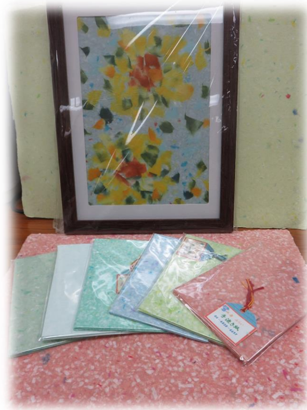
今回は『織り製品(B型)』です！