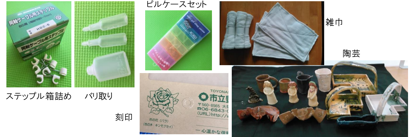
ステップル箱詰め バリ取り 刻印

第2みらいでは業者さんや市からの協力を得て、色々な作業に取り組んでいます。それぞれの作業工程を細分化し、利用者の皆さんには得意な工程で関わっていただけるように工夫をしています。